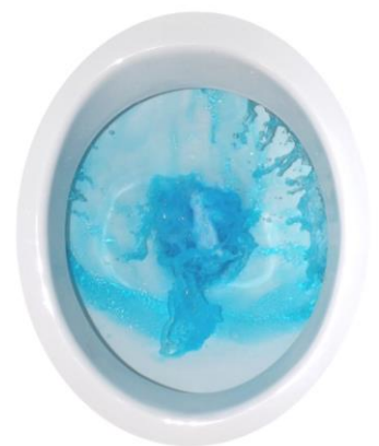
WC Becken beim Spülvorgang

Der WC-Star wird kinderleicht mit nur wenigen Handgriffen im Spülkasten eingehängt. Kein bohren, kein kleben, kein umständliches hantieren, Deckel vom Spülkasten entfernen, freien Platz finden und einhängen.